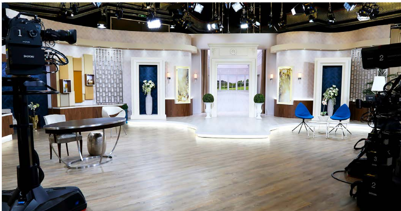
Plateau TV QVC ©

Paris, 03 août 2015 - QVC France annonce le lancement de sa propre chaîne de télévision, active depuis le 1 er août, finalisant ainsi sa phase de démarrage commercial, amorcée le 23 juin avec la mise en ligne réussie de son site e-commerce.